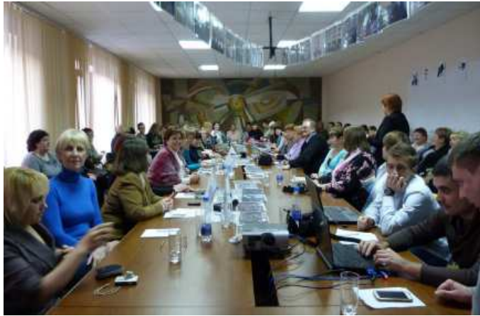
Конференція «Славське-2013» збрала бібліотекарів з усієї України

Конференція проходила в цікавому інтерактивному форматі: команди учасників відвідали численні майстер-класи, брали уроки у адвокаційній, психологічній, дидактичній майстернях, отримали поради у Школах майбутніх лідерів «Як стати директором бібліотеки» та «Як стати вченим-бібліотекознавцем». В межах конференції відбулись акція «Бібліотечна фотосушка» (кожен тренер привіз із